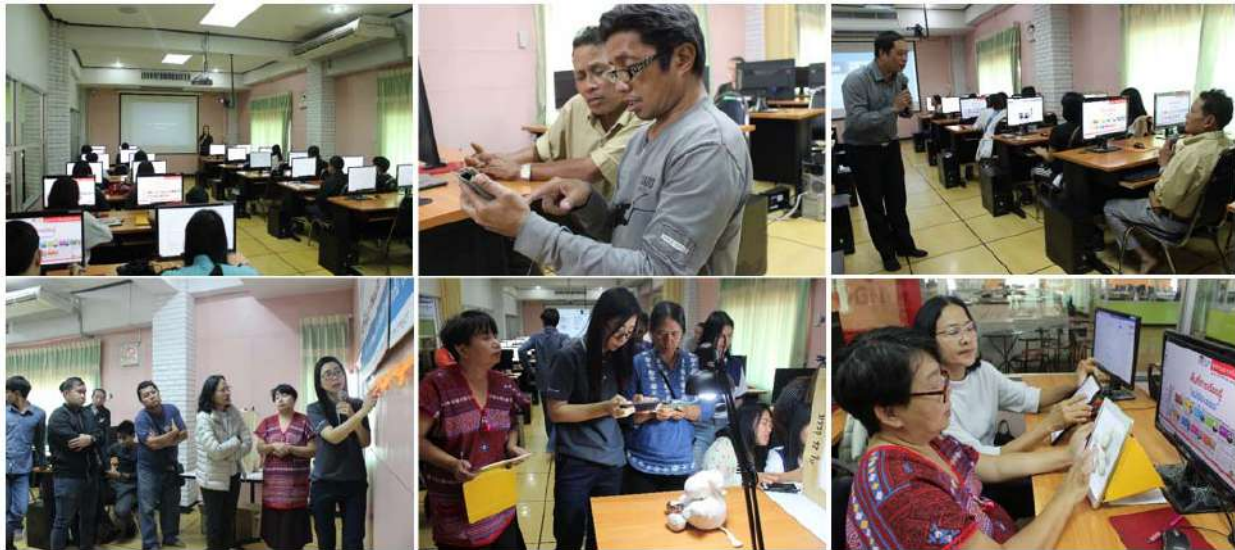
อบรมวันที่ 4 - 5 มี.ค. 62 เวลา 09.00 - 16.00 น. ผู้เข้าอบรม 30 ราย