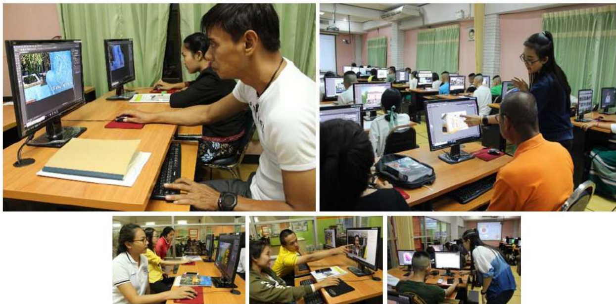
อบรมวันที่ 6 - 10 พ.ค. 62 เวลา 17.00 - 21.00 น. ผู้เข้าอบรม 38 ราย