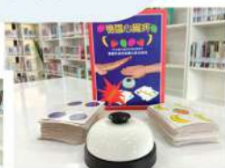
Halli Galli (ตึกระดิง)