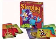
Sleeping Queens (เจ้าหญิงนิทรา)