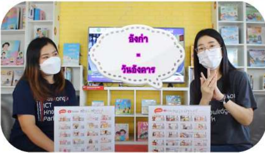
ตอน ภาษานำรู้จากวัน (ภาษาไทยใหญ่ - กะเหรี่ยง)