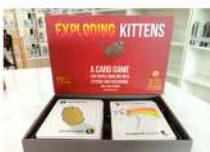
Exploding Kittens (แมวระเบิด)