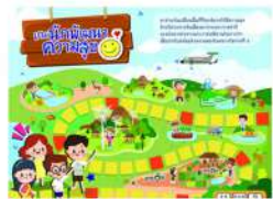
นักพัฒนาความสุข

ต้องการเล่นบอร์ดเกม ติดต่อได้ที่ คาบิเตอร์ศูนย์ ICT อุทยานการเรียนรู้แม่ฮ่องสอน