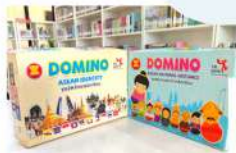
โดมิโน่ อาเซียน

เสริมสร้างการเรียนรู้ด้วยบอร์ดเกม เล่นที่รอบรู้ก็มีเชื้อ