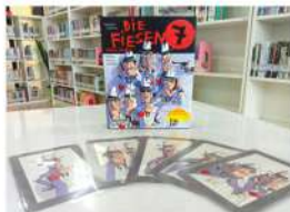
Die Fieseln 7 (แก๊งป่วน ก๊วนเจ็ด)