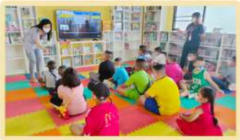
วันเสาร์ที่ 19 มิถุนายน 2564 ภาษาารู้ "ประโยชน์ใช้ที่กตัญญูภาษากระหริย"