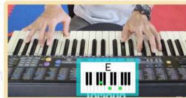
วันอาทิตย์ที่ 27 มิถุนายน 2564 EP : 10 สอนเล่นเพลง ทะเลสีด้า คีย์บอร์ด