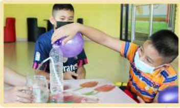
วันเสาร์ที่ 5 มิถุนายน 2564 ทดลอง "พลุลมจากลูกโป่ง"