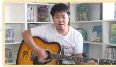
วันอาทิตย์ที่ 13 มิถุนายน 2564 EP : 10 สอนเล่นเพลง ดวงดาวแห่งรัก กีตาร์